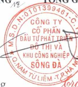
Trần Việt Dũng