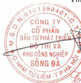
Trần Việt Dũng